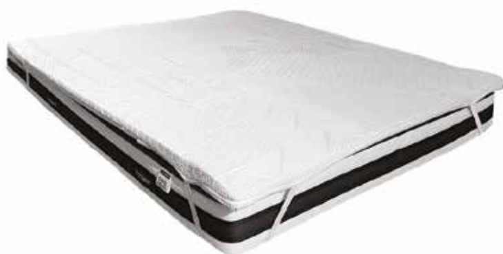
Tessuto in Silver & Carbon Power